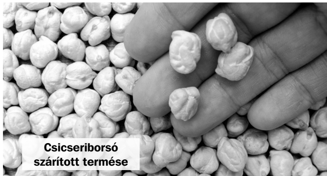
Csicseriborsó szárított termése

gazdálkodó van, leginkább magról próbáljuk szaporítani növényünket. Folyóméterenként kb. 30 db magot vessünk 4-5 cm mélyen. A csicseribor-