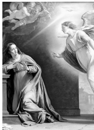
Angyali üdvözet (Philippe de Champaigne festménye)

Az egyház 624 óta ünnepeli annak emlékét, hogy Isten elküldte Gábiel arkangyalt azért, hogy hírül vigye Szűz Máriának az Istenanyaság nagy titkát: a Megváltó születését.