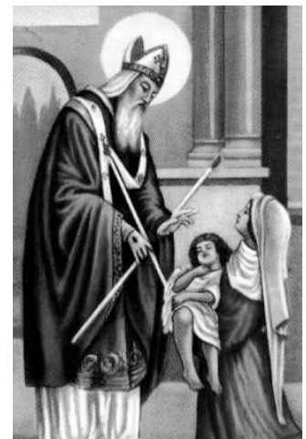
(Folytatás a 2. oldalon!)

da szerint megmentett egy halszájkát nyelt fiút. Mivel Magyarországon még a 20. század első felében is – a védőoltás bevezetéséig – rettegett és sok áldozatot követelő betegség volt a diftéria, más