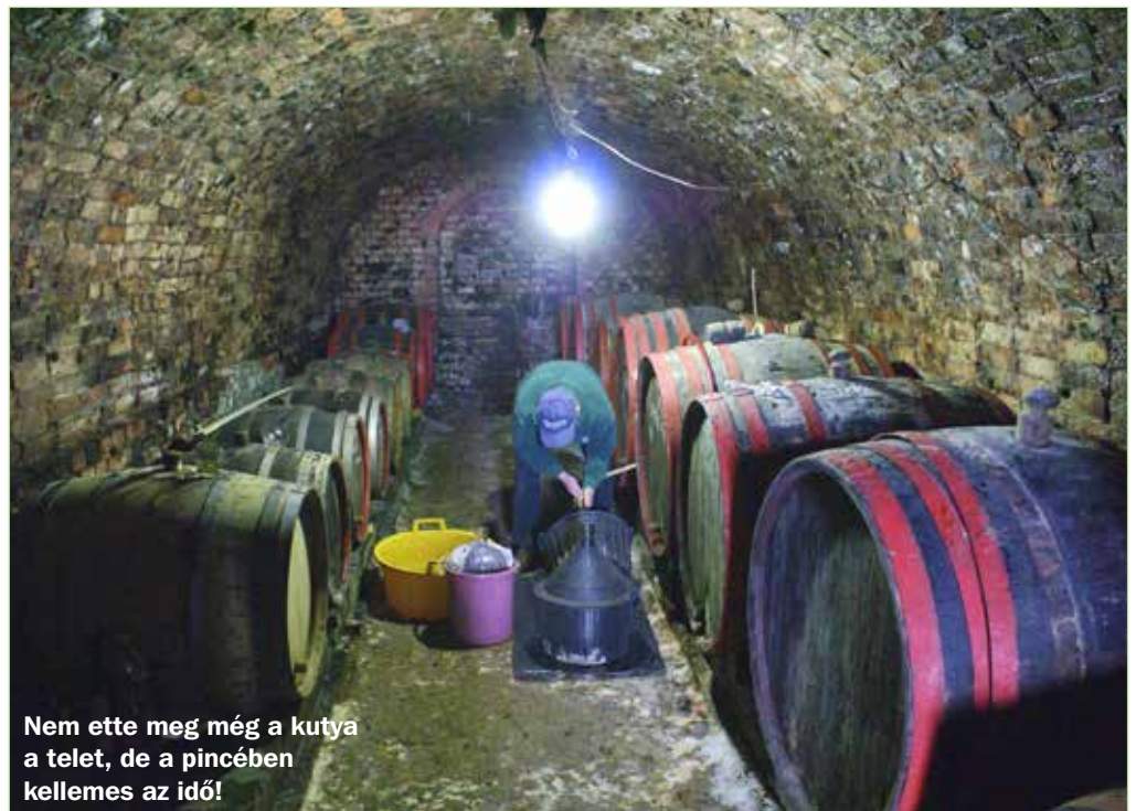
Nem ette meg még a kutya a telet, de a pincében kellemes az idő!