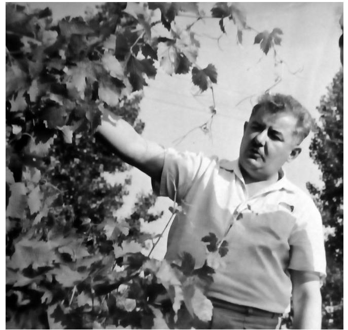
Szőlő hibridek tanulmányozása közben

Nagyon érdekes, hogy december hónapban több magyar szőlőnemesítőre is emlékezünk születése vagy