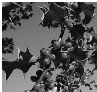
Közönséges magyal ( Ilex aquifolium )

A tél kétségtelenül az örökzöldek időszaka, hisz míg ilyen tájt a lombhullatók már csak a csupasz ágaikkal formálják a természetet, addig az örökzöldek még ekkor is az élet folytonosságát, az élni akarást hirdetik. Bár számtalan örökzölddel találkozhatunk ebben az évszakban, talán a fenyők mellett mégis a magyal, a fagyöngy és a tiszafa azok, melyek először eszünkbe juttatják