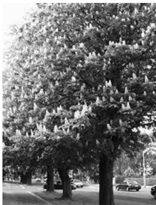
Virágzó vadgesztenyefa és szelídgesztenye levél és termés

Az elmúlt hetekben egy furcsa kommentháború bontakozott ki a Katonatelepi Közélet zárt Facebook csoportjában. A félreértések és téveszmék elkerülése miatt, szeretnék néhány tudományosan megalapozott tényet ebben a témakörben ismertetni. Nyilvánvalóan látszik, hogy a vita egyáltalán nem magáról a növényről szól, hanem inkább magatartás, hozzáállásbeli problémákkal, nem árt, ha több ismerettel rendelkezünk a vita tárgyába keveredett növényről. Egyet azonban mindenképpen tisztázni kell, a Katonatelepen sok kertben, vagy ház előtt, található vadgesztenye termése nem ehető! Alkalmazhatósága leginkább a gyerekeknek érdekes, kis figurák, szobrocskák készítésénél, vagy esetleg a lentebb leírt tulajdonságait kihasználva, a mosás gazdaságosságának csekély növelésére. Viszont semmiképpen sem gazdasági haszonnövény, kizárólag díszítő fa, kár vitatkozni a termések begyűjtésének jogosságáról!