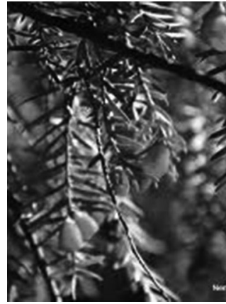
Tiszafa ( Taxus sp. )

és temető is e méltóságteljes, akár 1000 évet is megélő fák közelébe épültek. A tiszafák lassú növesű örökzöldek, amik nyírás nélkül közép magas, jellegzetesen kupolaszerű koronájú fákká növekednek. Ugyanakkor vékony, de viszonylag hajlékony ágaik a rendszeres metszést is jól bírják, s képesek újból és újból megújulni. A belőlük ültetett sövény igen sűrű, mellyel szép kontrasztot alkotnak a belül lyukas élénkpiros bogvoétermések. Mivel azonban kétivarú növény, ahhoz, hogy terméseket is érleljen, hímivarú egyedek is kellenek a termősök mellé.