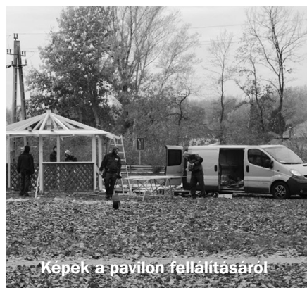
Képek a pavilon fellállításáról

tér építése Katonatelepen szinte teljesen bizonyosan átkerül, 2020-ra. Túlzottan nem örülök, hiszen szép befejezése lett volna a képviselői munkámnak, de panaszra így sincs okom, különösen azért, mert megkezdődött a bölcsődei pályázat anyagának előkészítése. Ez azt jelenti, hogy a 2019 végén kezdődő új képviselői ciklus igencsak jól fog kezdődni, és ez az újabb 5 év már több teret enged a kisebb érdekcsoportok számára fontos fejlesztéseknek, úgy, mint közvilágítás, utak portmentessé tétele.