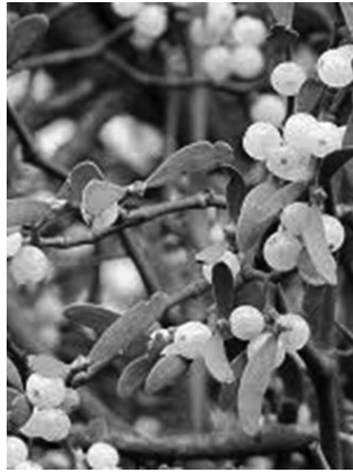
Fehér fagyöngy ( Viscum album )

A fehér fagyöngy jellegzetes zöldessárga levelekkel tarkított gömbölyű ágrendszerrel minden évben lombhullás után válik csak láthatóvá, így feltűnése a téli időszak előhírnökévé tette ezt a féltélősködő, ugyanakkor gyógyító hatású növényt. A lombhullató fák koronájában megtelepedő fagyöngy decemberre érleli meg fehér színű opálos bogvoit, melyek már az ősi skandinávok és kelták hitvilágában is a rossz távoltartására, a termékenység serkentésére, az életerő fokozására szolgáltak. A fagyöngy jótékony hatóanyagait ma is használják érelmeszesedés ellen, vérnyomás szabályozására, szívproblémák orvoslására. A növény lédús bogvoit a madarak is szívesen fogyasztják, és áttelesen épp ők gondoskodnak a növény fennmaradásáról is. A mágikus fagyöngy a régmúlt velünk élő mítoszai szerint inspirációt ad azoknál a döntéseinknél, melyekben nincs mellettünk támasz, s mint a szeretet és a barátság szimbolikus jelképe át-hatja a karácsony ünnepét és az azt kísérő adventi díszeket is.