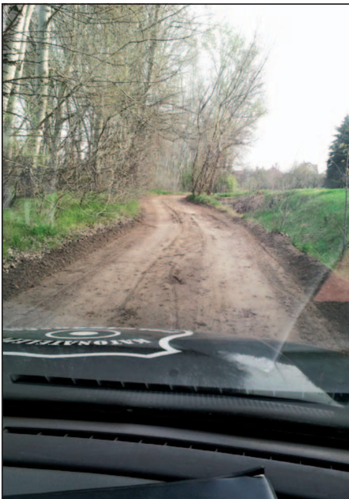
Folyómeder gréderezés, így nem folyik le az útról a víz, és 2 hét múlva újra lehet számlázni