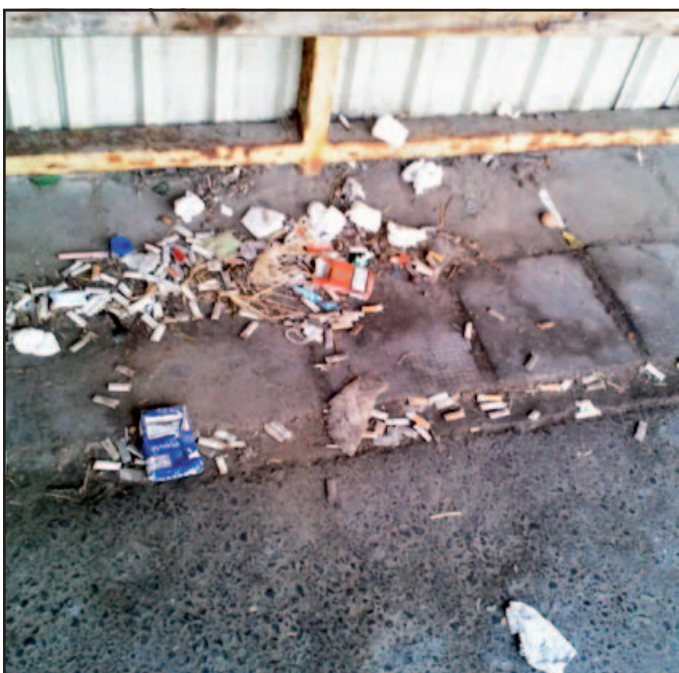
Közben a buszmegálló szemetese üres.