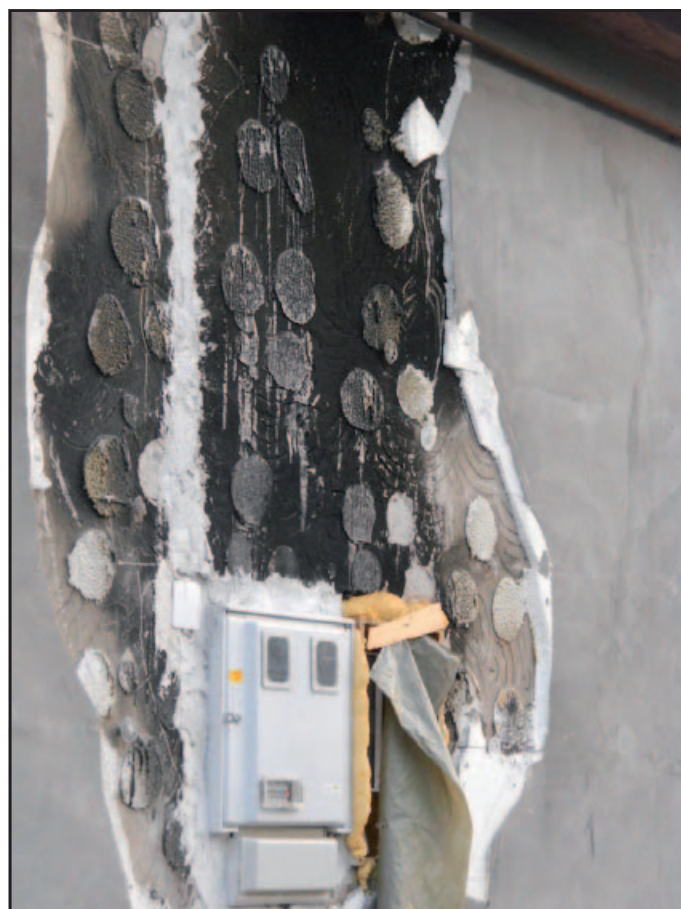
Váratlanul lángra lobbant villanyóraszekrény. Ha nincs a szomszédnak poroltója, a ház porig ég – a tűzoltók szerint.