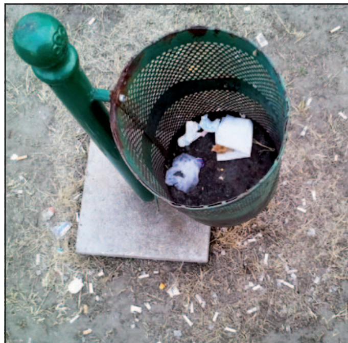
Buszmegálló a Jegenyefa utcában. A balkáni jelző sértő... a balkániakra...