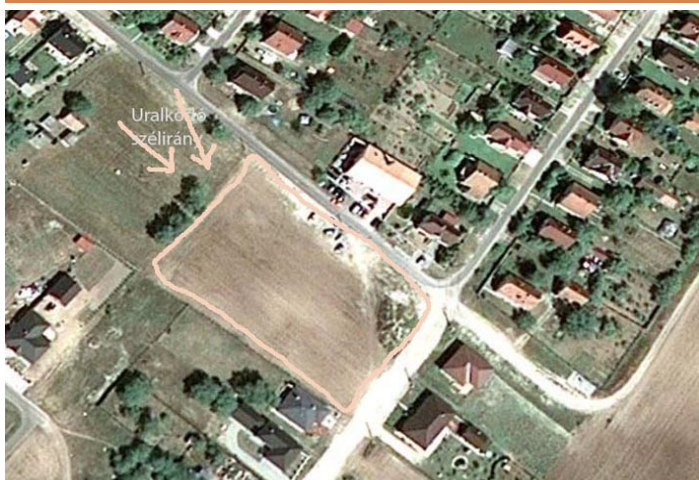
A Jegenyefa utca végén levő sportpálya, 1996 óta sport, szabadidős funkcióra betervezett hely. (A lenti fotón is.)

A bolhából elefánt ügyet a magam részéről ezennel lezártam, amellettt hogy akár Méntelekről, akár Nagykőrösről, vagy Ballószögről mondaná meg valaki a Katonatelepieknek, hogy mi a jó és rossz nekik, én továbbra is a katonatelepi álláspontokat összegezve dolgozom, akár képviselőként, akár pedagógusként, vagy polgárőrként.