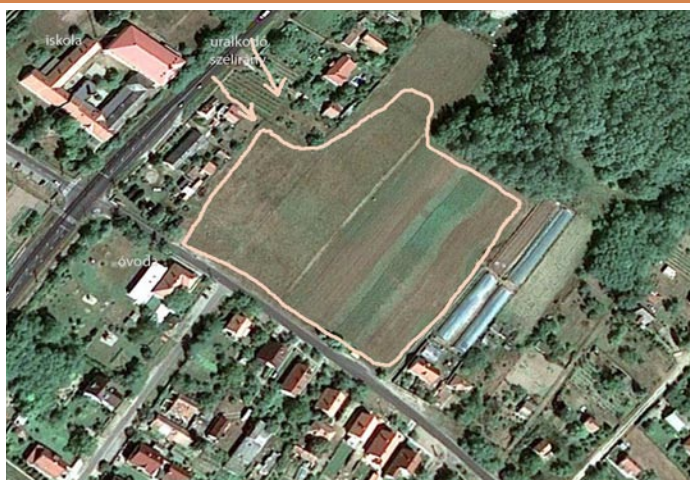
A Platán utcai ominózus terület. Ki-ki legjobb, ha maga hasonlítja össze, hány lakóház van/lesz a közvetlen szomszédságban.