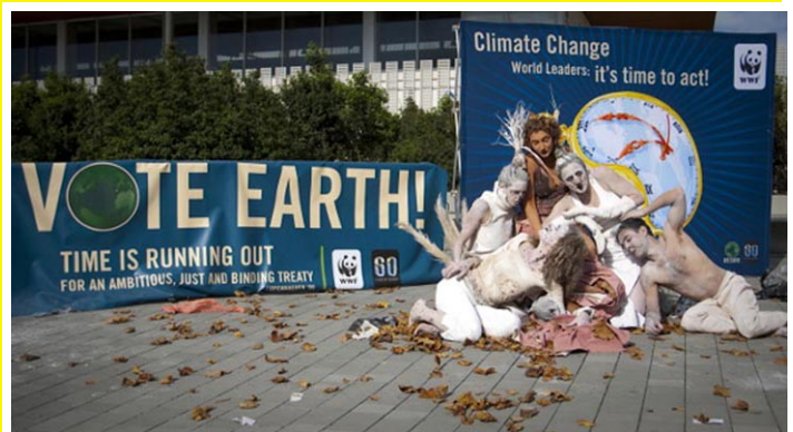
WWF-performansz Barcelonában. A spanyol kikötővárosban 180 ország döntéshozói a koppenhágai klímacsúcs előtti utolsó, ötnapos ENSZ-tanácskozási fordulóra gyűltek össze november 2-án.