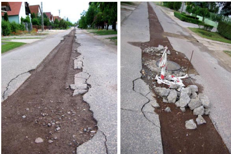
Ezen az utcán, a sok hónapos taposás töredezés nemcsak a gépkocsi tulajdonosoknak, hanem a kivitelezőnek is sok kárt okoz. Jobb szervezéssel ez elkerülhető lett volna.