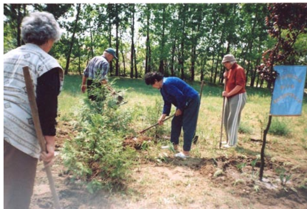
A nyugdíjasklub, aktivitásával, közéleti szerepvállalásával, igencsak magasra teszi a mérsét, a fiataloknak!