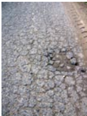
Ezen jár a busz. Már nem sokáig...